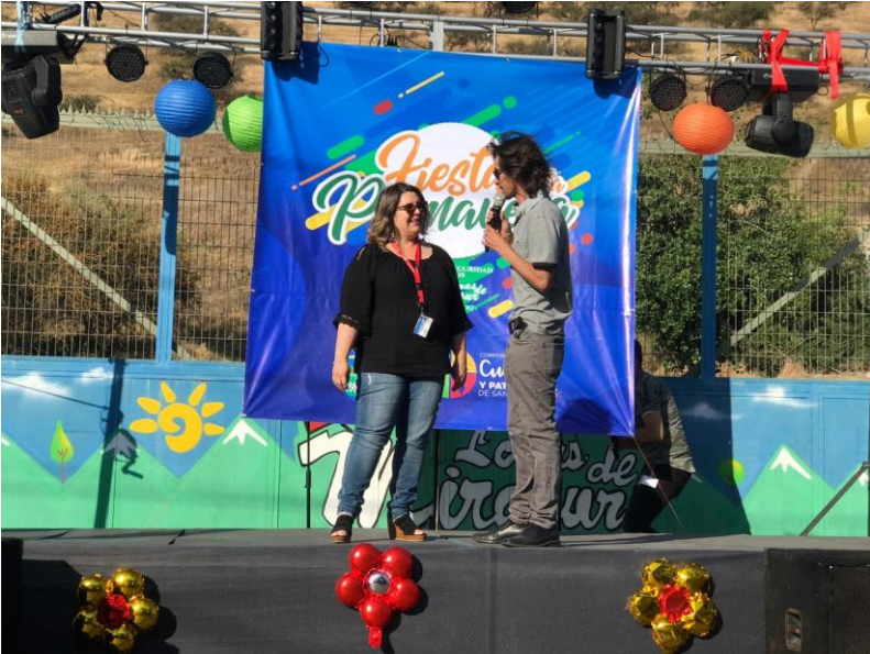
Actividad Memoria y Patrimonio Ferroviario Villa Los Aromos